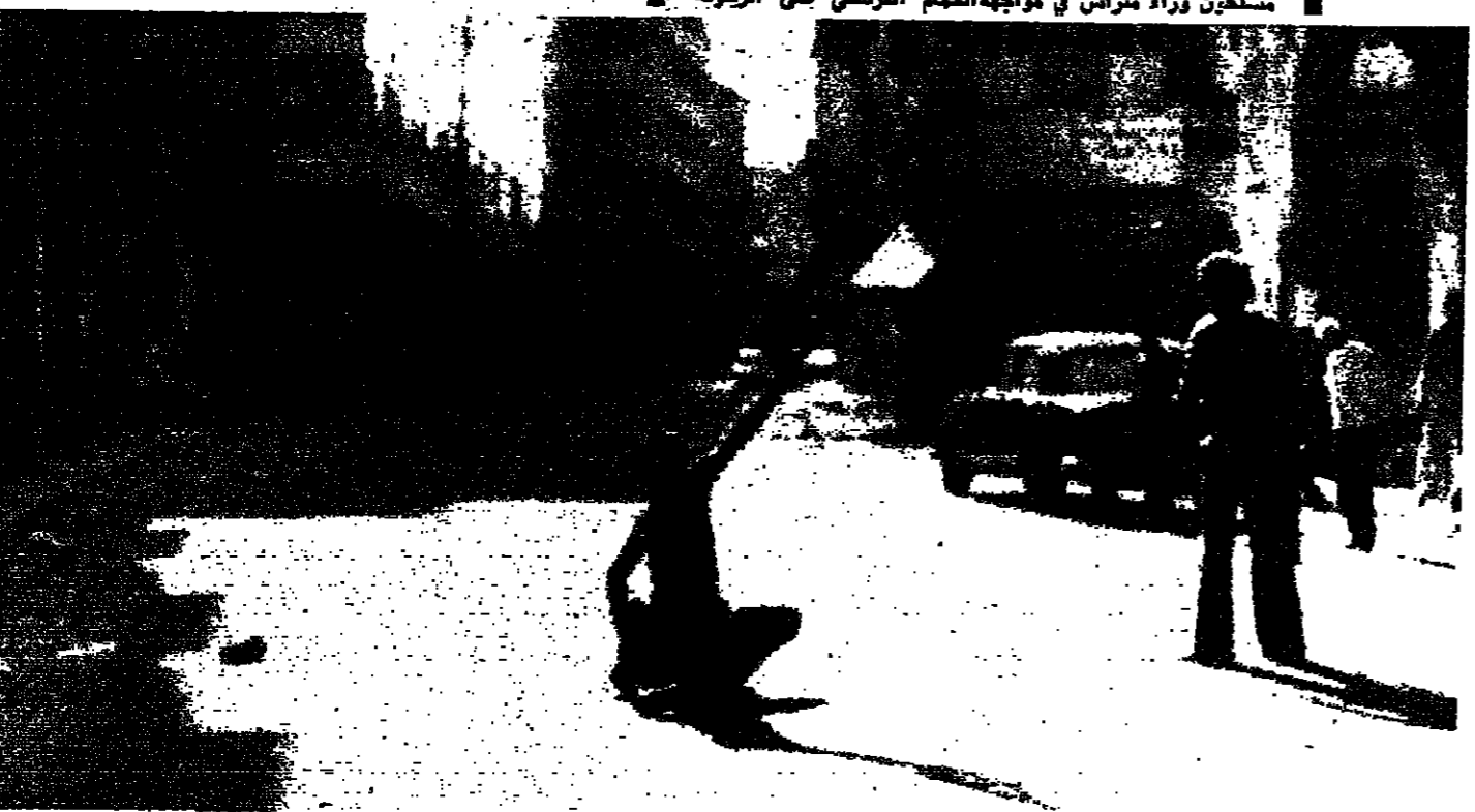
اطلاق الرصاص وسط الشارع